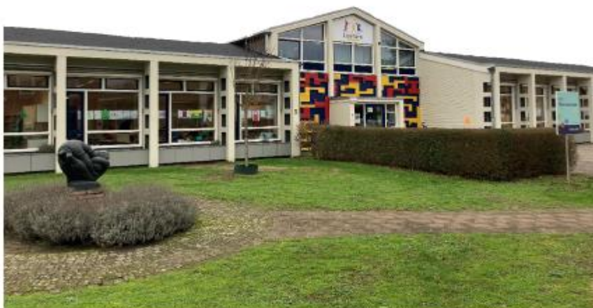
Stichting Schoolbestuur Laetare